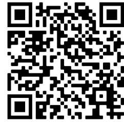
ภาพที่ 1 แสดง QR-Code ระบบตรวจสอบคะแนนสอบ

นักศึกษาสามารถเข้าตรวจสอบคะแนนสอบของตนเองได้ ด้วยเว็บเบราว์เซอร์ (Web Browser) ที่ลิงก์ www.intranet.econ.tu.ac.th/checkscore หรือสแกน QR-Code ดังภาพที่ 1